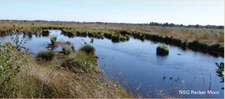
NSG Recker Moor

In diesem Faltblatt haben wir einige Freizeittipps zusammen gestellt, die Sie mühelos mit dem S10 erreichen können - ohne Anspruch auf Vollständigkeit.